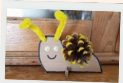
Escargot pomme de pin