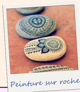
Peinture sur roche