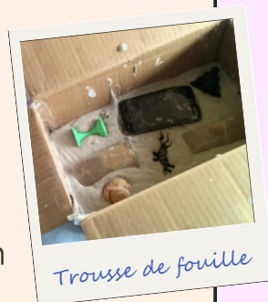
Trousse de fouille