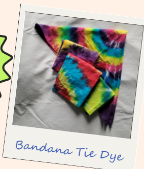
Bandana Tie Dye