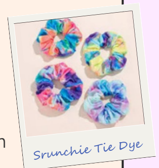
Srouchie Tie Dye