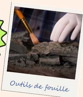
Outils de fouille