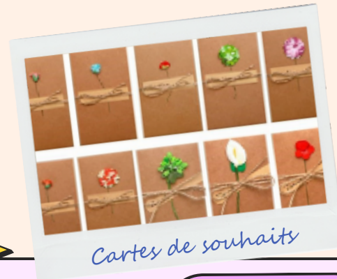
Cartes de souhaits