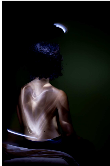
Un exemple de photographie de type "light painting"

La photographie obtenue révèle alors toutes les traces lumineuses dues soit à l'exposition directe du capteur à la source lumineuse, soit aux objets éclairés. Cette technique a notamment été utilisée dans la réalisation du vidéoclip « Lovers in Japan » du groupe musical britannique Coldplay.